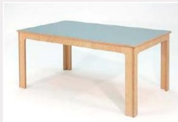
Immagine di : Tavoli per biblioteche Articolo : tm120dia