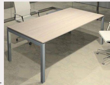
Immagine di : Tavoli per biblioteche Articolo : habitat