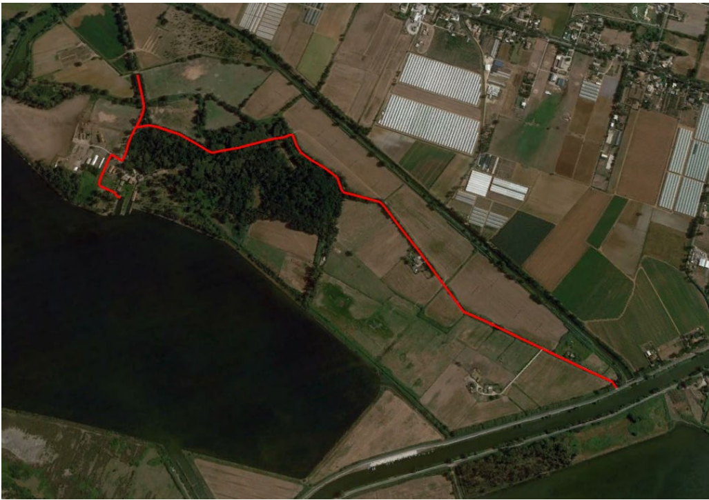
Area Borgo Fogliano.