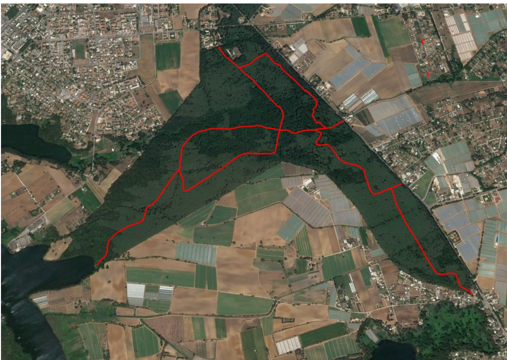
Area Centro visitatori del Parco.